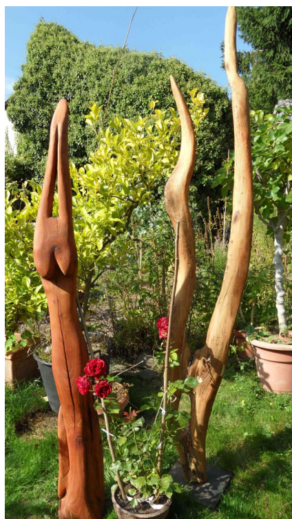
Yoga und Harfe

Auch in diesem Jahr findet erneut die Kult(o)ur-Erlebnis-Reihe tArt-Orte im Nassauer Land statt. Die Aktion läuft noch bis zum 11. Juni 2023. An vielen Orten präsentieren Künstlerinnen und Künstler ihre Werke.