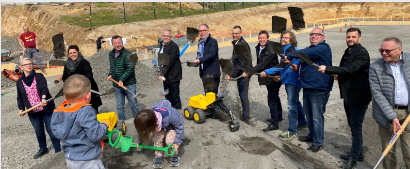
Viele freudige Gesichter beim Spatenstich für den Neubau der KiTa Villa Kunterbunt in Merenberg